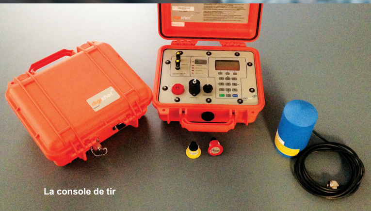
La console de tir