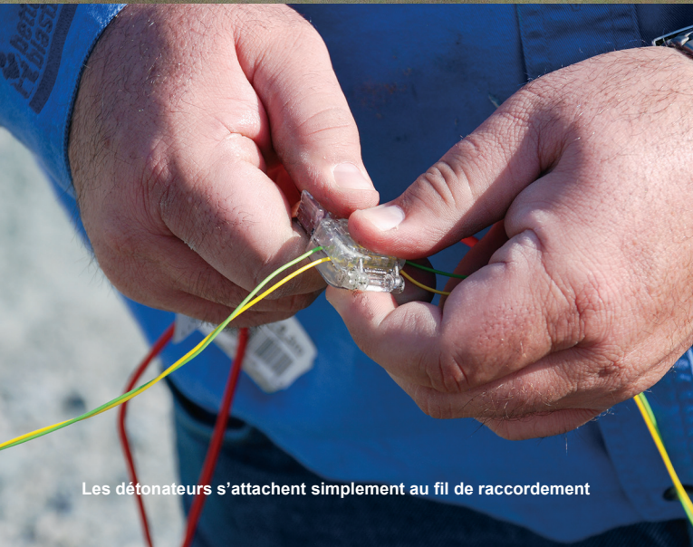
Les détonateurs s'attachent simplement au fil de raccordement